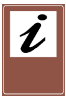
Centro de informações turísticas