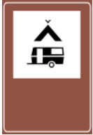
Área de camping