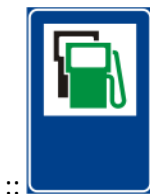
:: Posto de combustível