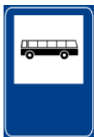
Parada de ônibus