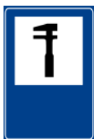
Mecânico ou local para auxílio com o carro