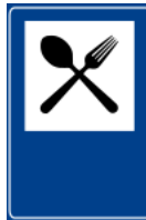
:: :: Hotel, bar e restaurante, respectivamente.