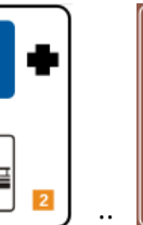
:: :: o P com fundo azul indica estacionamento. Acompanhado de desenhos secundários indicam (respectivamente na ordem): estacionamento com acesso a ônibus, estacionamento com acesso ao bonde, estacionamento com acesso às linhas metropolitanas ou ferroviárias e estacionamento com acesso, a pé, a pontos turísticos.