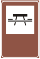
Área para piquenique