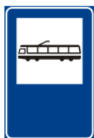
Parada de Tram (Bonde)