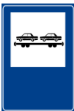
Transporte de veículos de passageiros através de trem.