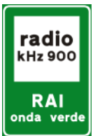
Rádio de informação sobre as estradas – Indica a frequência de ondas na qual podem receber as notícias úteis para o tráfego rodoviário.